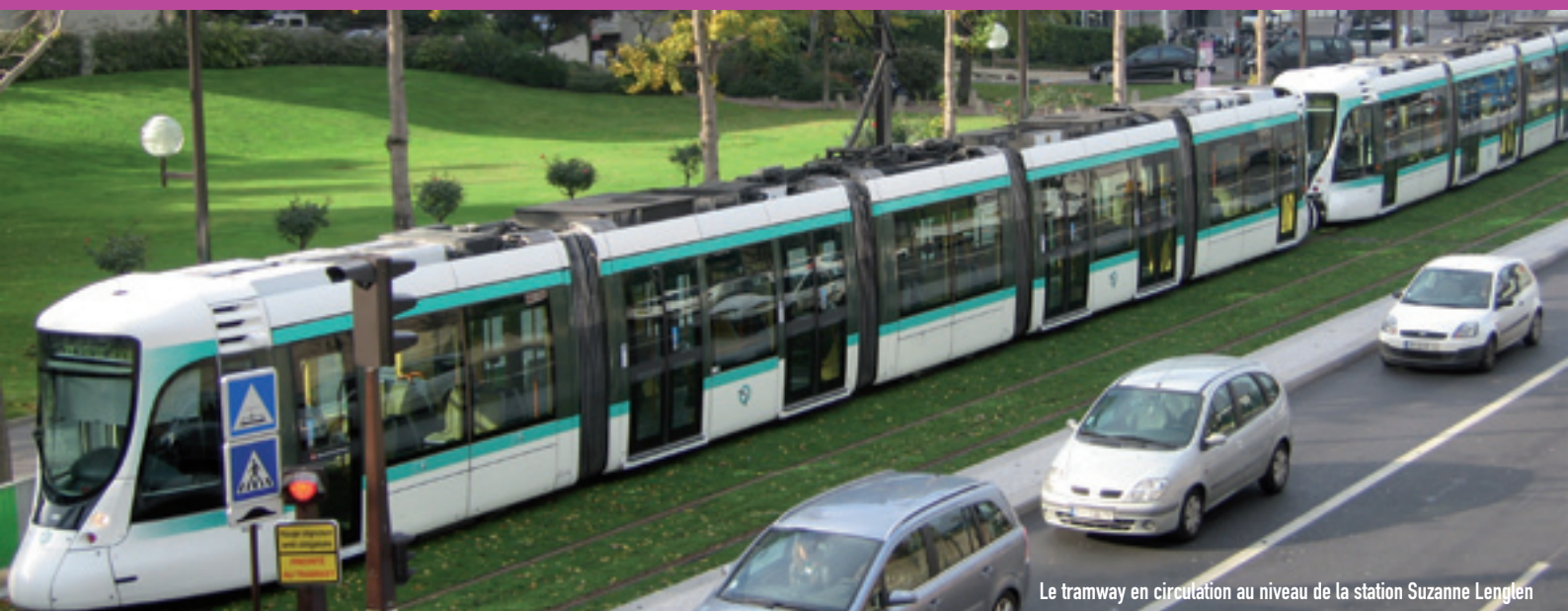
Le tramway en circulation au niveau de la station Suzanne Lenglen

EXTENSION JUSQU'À PARIS - PORTE DE VERSAILLES