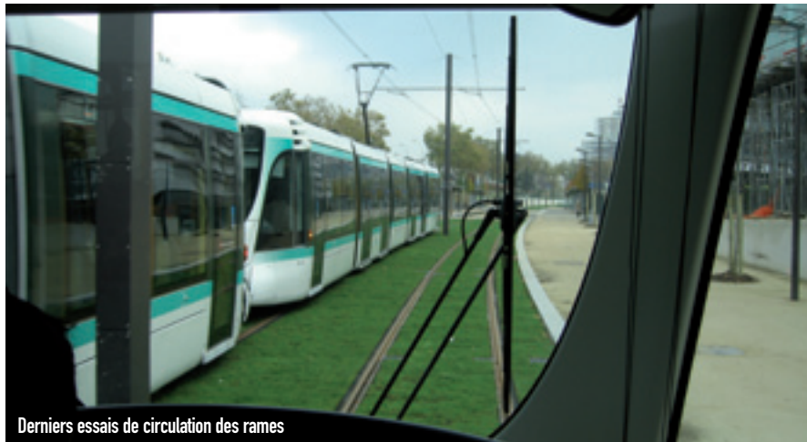
Derniers essais de circulation des rames

Depuis le 9 novembre, le tramway connaît sa dernière épreuve avant la mise en service prévue pour le 21 novembre : la « marche à blanc ».